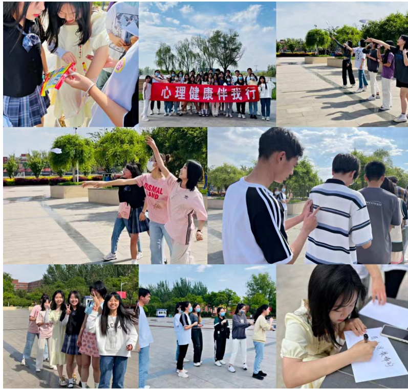
2105 班心理健康伴我行—心理健康主题班会活动