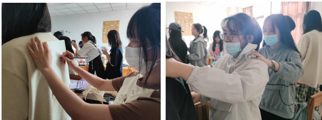
2103 班心理赋能，“疫”起同行——心理健康主题班会活动

心理健康教育主题班会是大学生心理健康教育的重要形式之一，美术学院各班级心理委员充分发挥“朋辈支持互助”的作用，围绕同学们日常生活中关注或困惑的“心理健康”问题创新班会形式，加强宣传普及心理健康知识，切实帮助同学们缓解学习、生活方面的压力，培养学生良好的心理素养，增强同学们的自我调适能力，丰富心理健康教育内涵。