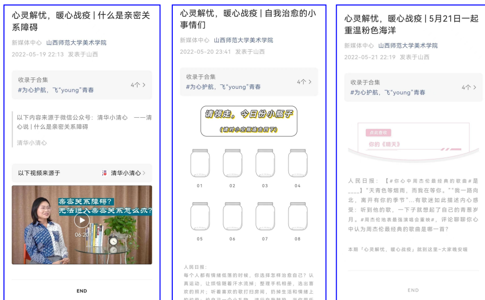
微信公众号部分推送内容展示